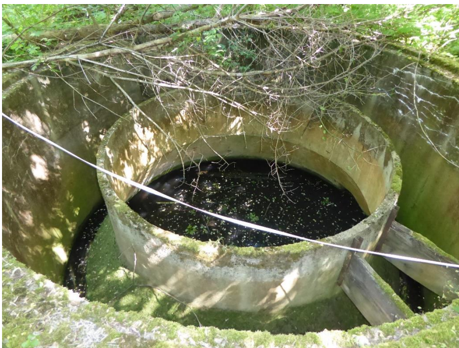
4. Obiekt oczyszczalni nr 2 (zbiornik większy)