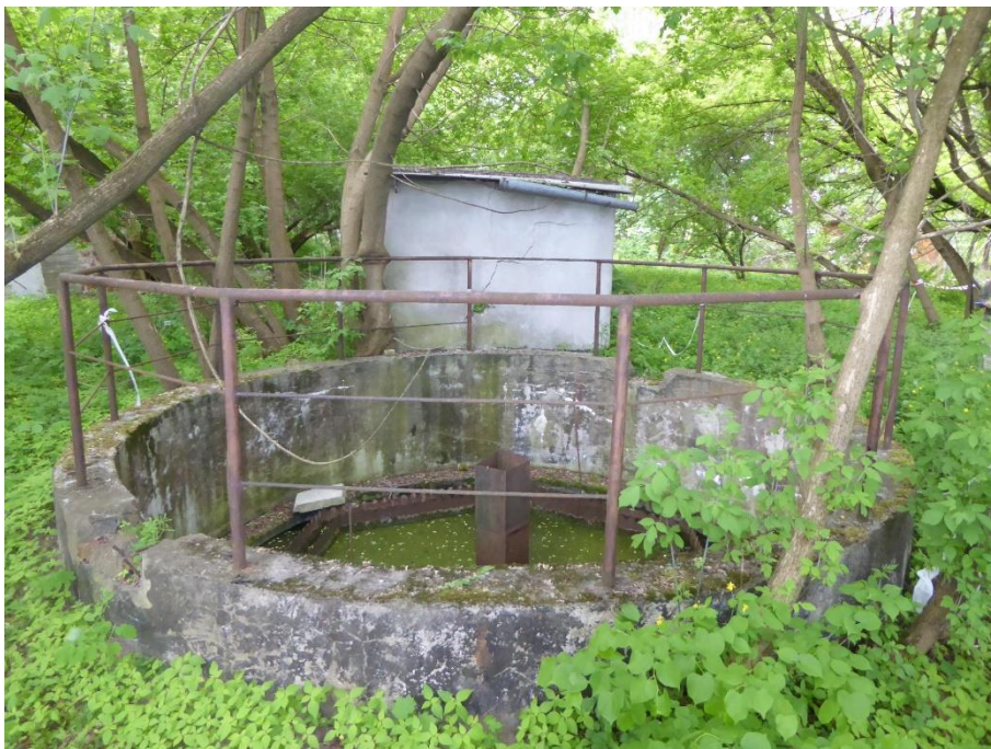
3. Obiekt oczyszczalni nr 1 (zbiornik mniejszy) wraz z pomieszczeniem obsługi