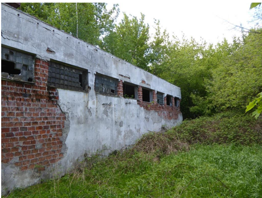
2. Budynek nr 2– elewacja północna