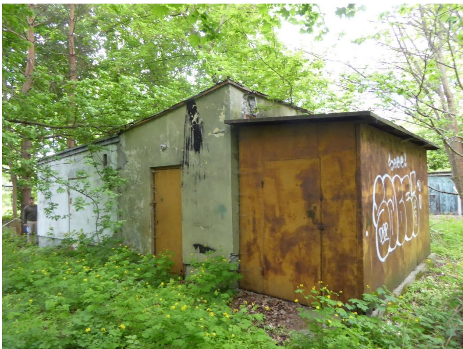
1. Budynek nr 1– elewacja wschodnia