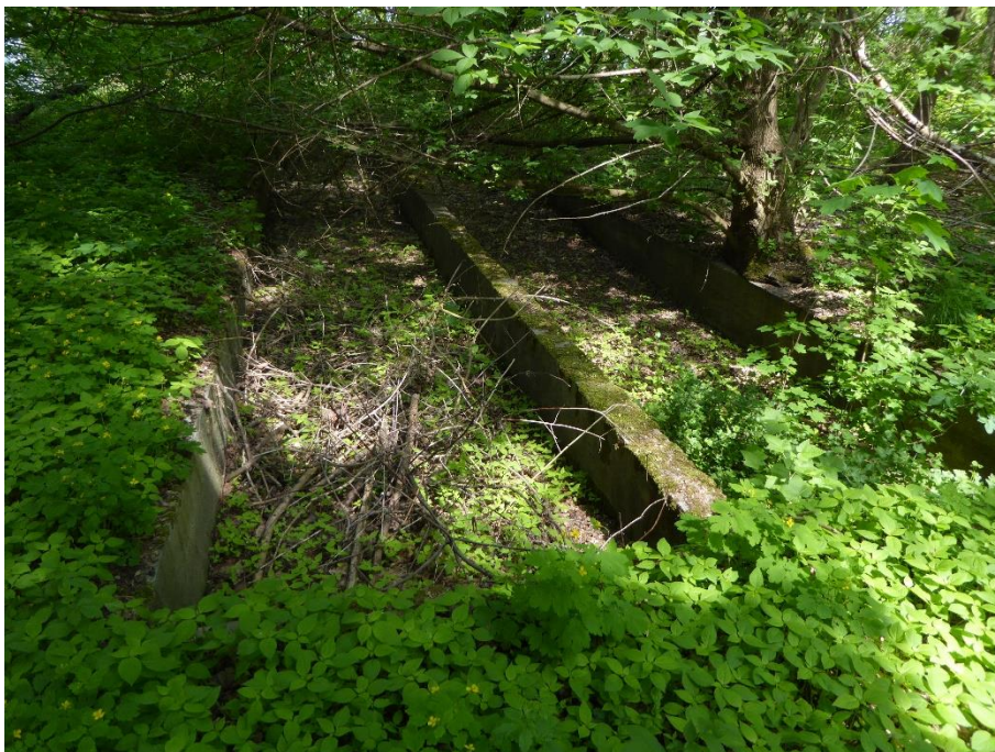
5. Obiekt oczyszczalni nr 3